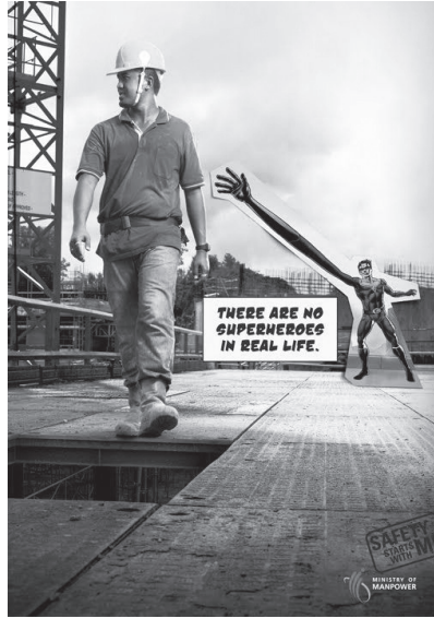
Resim 4. “Çukur” Konulu İş Güvenliği Reklamı