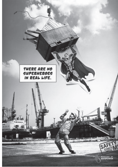
Resim 5. “Konteynır” Konulu İş Güvenliği Reklamı

“Konteynır” konulu iş güvenliği reklamı düz anlam boyutunda ele alındığında, reklamın tersanede çalışan bir işçiyi konu edindiği görülmektedir. Görsel kodlar içerisinde, taşıyıcı halatın kopması üzerine büyük bir konteynırın üzerine düştüğü aktarılmaktadır. Bu süreçte, çizgi roman karakteri Süpermen, uçarak konteynırı tutmakta ve işçinin hayatını kurtarmaktadır. İşçinin jestlerin, konteynıra karşı çaresizliğini ve korkusunu yansıtmaktadır. Reklamda, incelenen bir önceki reklamda olduğu gibi “Gerçek hayatta süper kahramanlar yoktur” yazılı kodu yer almaktadır.