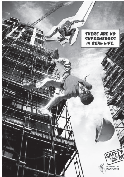
Resim 6. “İnşaat İskelesi” Konulu İş Güvenliđi Reklamı

“İnşaat İskelesi” konulu iş güvenliđi reklamı düzanlam boyutunda ele alındığında, reklamda büyük bir iskeleden düşmekte olan bir işçi konu edilmektedir. İşçi, yüksek bir inşaat iskelesinden aşağı doğru düşmektedir. Bu aşamada çizgi roman karakteri örümcek adam, işçiye uzanmakta ve onu kurtarmaya çalışmaktadır. Reklamdaki kinetik göstergeler içerisinde işçinin jest ve mimiklerinden iş kazasına karşı korku ve çaresizliđi yansıtılmaktadır. Reklamda, incelenen diđer iki Singapur iş güvenliđi reklamında olduđu gibi İngilizce “Gerçek hayatta süper kahramanlar yoktur” yazılı kodu yer almaktadır.