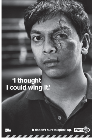
Resim 1. “Yaralı Yüz” Konulu İş Güvenliği Reklamı

kodları içerisinde adamın mimikleri, adamın sakin ve sessiz olarak yansıtmaktadır. Reklamda İngilizce “I thought I could wing it!/Yapabileceğimi düşündüm” yazılı kodu yer almaktadır.